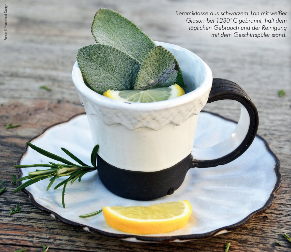
Keramiktasse aus schwarzem Ton mit weißer Glasur: bei 1230°C gebrannt, hält dem täglichen Gebrauch und der Reinigung mit dem Geschirrspüler stand.